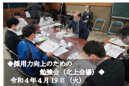
◆採用力向上のための勉強会（北上会場）◆ 令和4年4月19日（火）

参加企業からは、「今の生徒の考えや状況が聞けて良かった」「イベントが中止になる中、直接、話が聞けて良かった」「学校の先生からリアルな情報を聞くことができ、たいへん参考になった」との感想や「生徒が志望先を決める時期が思ったよりも早いこと、進路決定には親の意向が強いこと等が参考になった」との意見を多くいただきました。