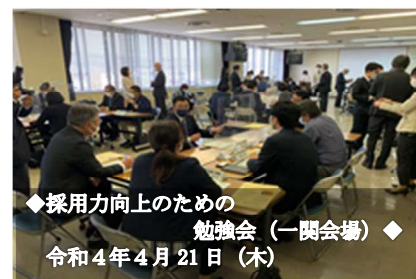
◆採用力向上のための勉強会（一関会場）◆ 令和4年4月21日（木）