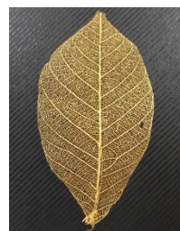
体験教室 「金の葉っぱ」