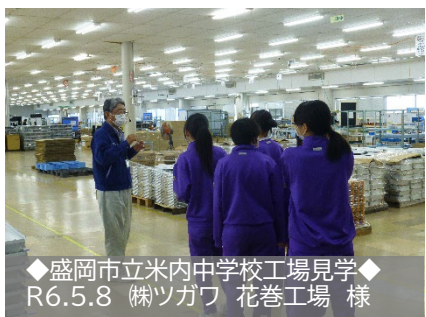
◆盛岡市立米内中学校工場見学◆ R6.5.8 (株)ツガワ 花巻工場 様

5月8日(水)に盛岡市立米内中学校2学年、5月17日(金)に滝沢市立滝沢小学校5学年が工場見学を実施し、延べ145名の児童・生徒が参加しました。御協力いただきました企業の皆様にはお忙しい中での御対応に感謝いたします。今年度は昨年度と比べ、数多くの小中学校から工場見学や出前授業の問い合わせ、お申込みをいただいております。引き続き御協力のほどよろしくお願いいたします。