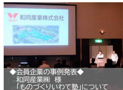
◆会員企業の事例発表◆ 和同産業(株) 様 「ものづくりいわて塾」について