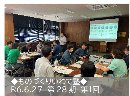
◆ものづくりいわて塾◆ R6.6.27 第28期 第1回

御協力・御参加いただきました企業の皆様にはお忙しい中での御対応に感謝いたします。引き続き御協力のほどよろしくお願いたします。