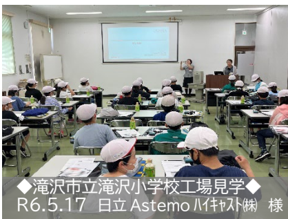
◆滝沢市立滝沢小学校工場見学◆ R6.5.17 日立 Astemo 刈苅社(株) 様