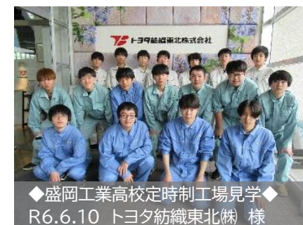
◆盛岡工業高校定時制工場見学◆ R6.6.10 トヨタ紡織東北㈱ 様