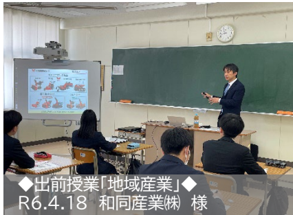
◆出前授業「地域産業」◆ R6.4.18 和同産業㈱ 様