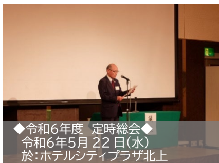
◆令和6年度 定時総会◆ 令和6年5月22日(水) 於:ホテルシティプラザ北上

地域が一体となり優れた人材を育て、岩手で育った人材が地域に貢献していく姿を目指し、小学校からの各段階に応じたものづくり人材の育成に取り組みます。