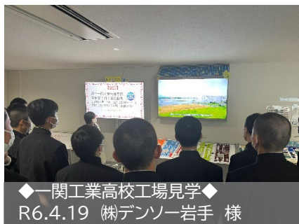
◆一関工業高校工場見学◆ R6.4.19 ㈱デンソー岩手 様

4月19日(金)に一関工業高校、6月10日(月)に盛岡工業高校定時制が工場見学を実施し、延べ58名の生徒が参加しました。御協力いただきました企業の皆様にはお忙しい中での御対応に感謝いたします。引き続き御協力のほどよろしくお願いたします。