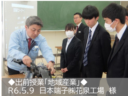
◆出前授業「地域産業」◆ R6.5.9 日本端子㈱花泉工場 様