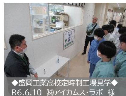
◆盛岡工業高校定時制工場見学◆ R6.6.10 ㈱アイカムス・ラボ 様