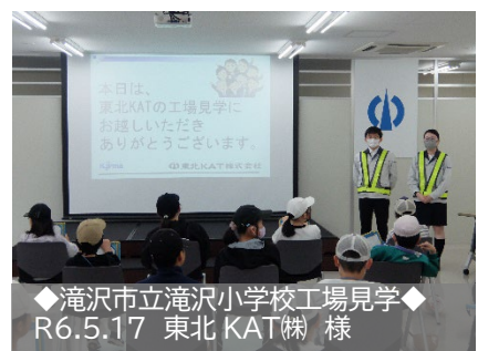
◆滝沢市立滝沢小学校工場見学◆ R6.5.17 東北 KAT(株) 様